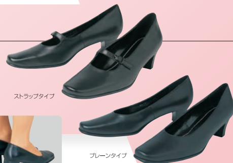
ストラップタイプ

就活ではかなりの距離を歩くことになります。歩きやすさ、疲れにくさを考えるとヒールは3~5cmが最も無難です。デザインは、太めのヒールで安定感のあるシンプルなお黒のポンプスが一般的です。