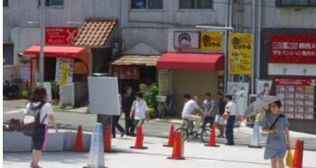
大学正門付近の様子

昔から関大生でにぎわう関大前通りには、現在も学生向けのお店がたくさんあり、飲食店だけでなく、美容院や文房具屋など、幅広いジャンルのお店がひしめきあっています。OBのみなさんも現役時代によく立ち寄ったのではないのでしょうか。昔から野球部に親しまれていた「衣笠」は、2年前の春に閉店してしまいました。しかし、多くの関大生でにぎわう「フタバボウル」や、150円でテイクアウトできるお好み焼きが部員から人気だったという「きゃべつはうす」など、昔ながらのお店が今もなお立ち並んでいます。