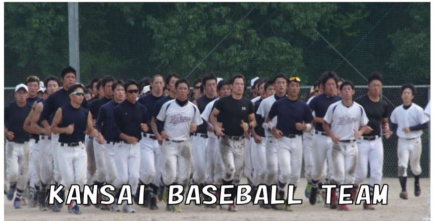
KANSAI BASEBALL TEAM